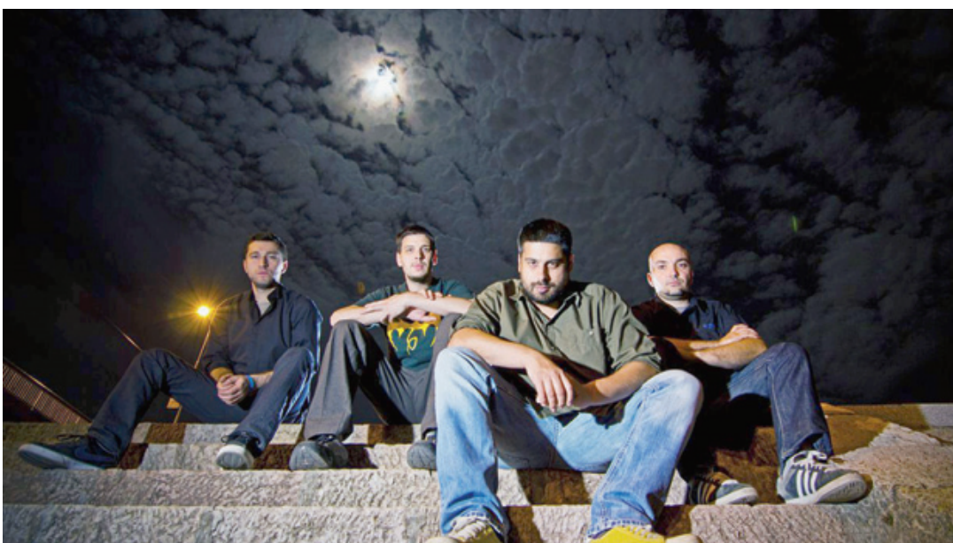
Au programme le 8 décembre: Eyot ou l'excellence du jazz serbe.