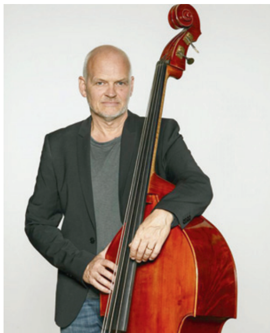
Lars Danielsson en point d'orgue à la saison, le 31 mai.